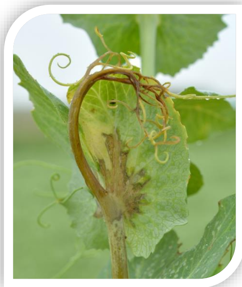
Bactériose sur pois

Cette maladie, qui apparaît généralement en foyers dans la parcelle, est favorisée par des blessures, occasionnées le plus souvent par le gel.