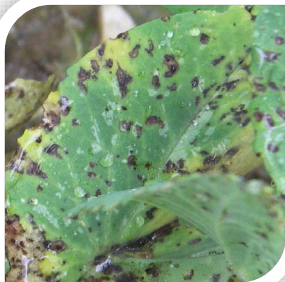
Ascochytose sur pois – Terres Inovia

Symptômes d'ascochytose : apparition de taches sur les feuilles, les tiges et les gousses de pois. Les feuilles sont ponctuées de petites taches circulaires.