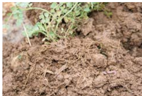
Légumineuse (vesce), effet sur la structure et la vie du sol

Azote absorbé par le couvert (kg/N/ha) en plus de l'azote du sol selon la biomasse du couvert (t/ha de M.S.)