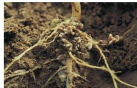
Nodosités : piégeage de l'azote de l'air