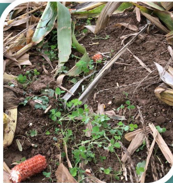
Couvert de trèfle dans les inter-rangs de maïs le 21/10/19

Couvert d'été : Radis fourrager AN3 + Trèfle d'Alex 5 + Féverole 30 + Phacélie 1,5 + Tournesol 4 Semis le 27/07/18