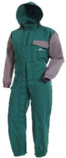
Combinaison AEGIS 89€ HT