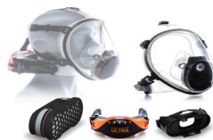
Cleanspace – pack phyto 1 490€ HT