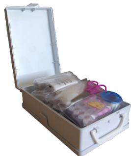
Coffret de secours 95,99€ HT