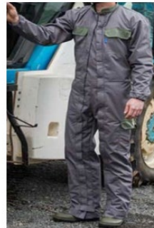
Combinaison CEPOVETT 75€ HT