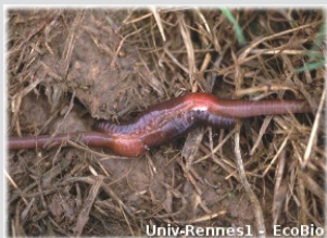
Univ-Rennes1 - EcoBio

La durée du cycle de reproduction est différente selon les espèces. Ainsi pour devenir adulte, 9 mois seront nécessaires pour une espèce de grande taille comme Lumbricus terrestris (anécique) contre seulement 45 jours pour une espèce de petite taille comme Eisenia foetida (épigé).